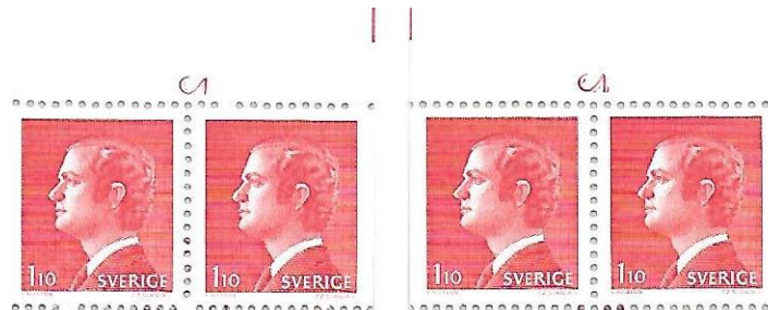
Figur 2. Till vänster visas H295I med c 2 som är mager och har foten rakt över det högra märkets kant. Till höger visas H295II med c 2, som är fetare och oskarp och mer centralt placerad.

Avståndet mellan höger regm och bild, b-måttet är urskiljande för det övre bandet på Cyl I med b=8.9 mm medan det för undre bandet på Cyl I och för båda banden på Cyl II är b=9.2 . Skillnaderna i övriga regm-mått är små. Om inlagan har cyls är det enkelt då cyls har olika positioner. Avståndet mellan c 1 och frimärksbild på Cyl I 3.8 mm och på Cyl II är det 4.3 mm. Figur 2 visar c 2 för de två cylindrarna. Det är enklast att observera att på Cyl I sitter foten rakt över det högra märkets kant medan på Cyl II är c 2 mer centralt placerad.