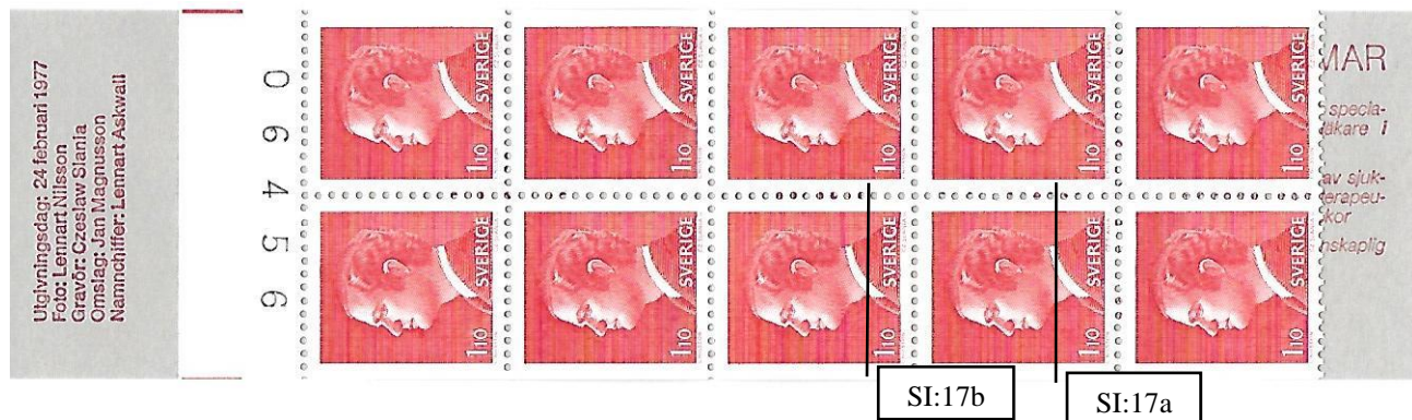
Figur 3. Positionerna för skadorna på inlaga 17 i nedre bandet på Cyl I