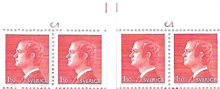
Figur 2. Till vänster visas H295I med c 2 som är mager och har foten rakt över det högra märkets kant. Till höger visas H295II med c 2, som är fetare och oskarp och mer centralt placerad.

Avståndet mellan höger regm och bild, b-måttet är urskiljande för det övre bandet på Cyl I med b=8.9 mm medan det för undre bandet på Cyl I och för båda banden på Cyl II är b=9.2 . Skillnaderna i övriga regm-mått är små. Om inlagan har cyls är det enkelt då cyls har olika positioner. Avståndet mellan c 1 och frimärksbild på Cyl I 3.8 mm och på Cyl II är det 4.3 mm. Figur 2 visar c 2 för de två cylindrarna. Det är enklast att observera att på Cyl I sitter foten rakt över det högra märkets kant medan på Cyl II är c 2 mer centralt placerad.