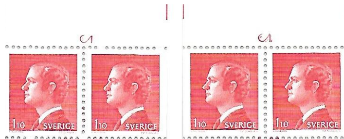
Figur 2. Till vänster visas H295I med c 2 som är mager och har foten rakt över det högra märkets kant. Till höger visas H295II med c 2, som är fetare och oskarp och mer centralt placerad.

Avståndet mellan höger regm och bild, b-måttet är urskiljande för det övre bandet på Cyl I med b=8.9 mm medan det för undre bandet på Cyl I och för båda banden på Cyl II är b=9.2 . Skillnaderna i övriga regm-mått är små. Om inlagan har cyls är det enkelt då cyls har olika positioner. Avståndet mellan c 1 och frimärksbild på Cyl I 3.8 mm och på Cyl II är det 4.3 mm. Figur 2 visar c 2 för de två cylindrarna. Det är enklast att observera att på Cyl I sitter foten rakt över det högra märkets kant medan på Cyl II är c 2 mer centralt placerad.