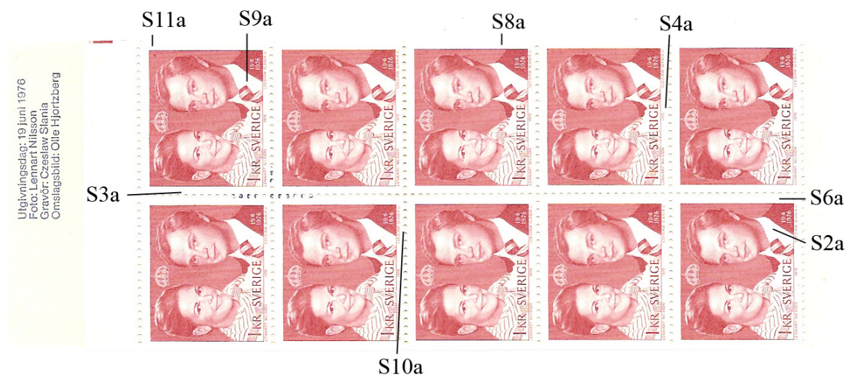
Tabell 2: Kännetecken på inlagor.

kombination med cyls, så sitter kn på inlagor med udda nummer. Om man har häften med kn i följd varav minst ett med kombination med cyls så är det lätt att fastställa nummer för de udda inlagorna. När det gäller numreringen av de jämna inlagorna behövs ett intakt cylindervarv eller helst en intakt 50-bunt. Först för några månader sedan fick jag tag i en öppnad förpackning med två 50-buntar. Det fanns enkla kn i dem. Genom att studera omslagsklichéer, förekomsten av cyls och om inlagorna kom som de skulle kunde jag konstatera att buntarna var intakta. Lyckan var stor. Äntligen hade jag alla pusselbitar.