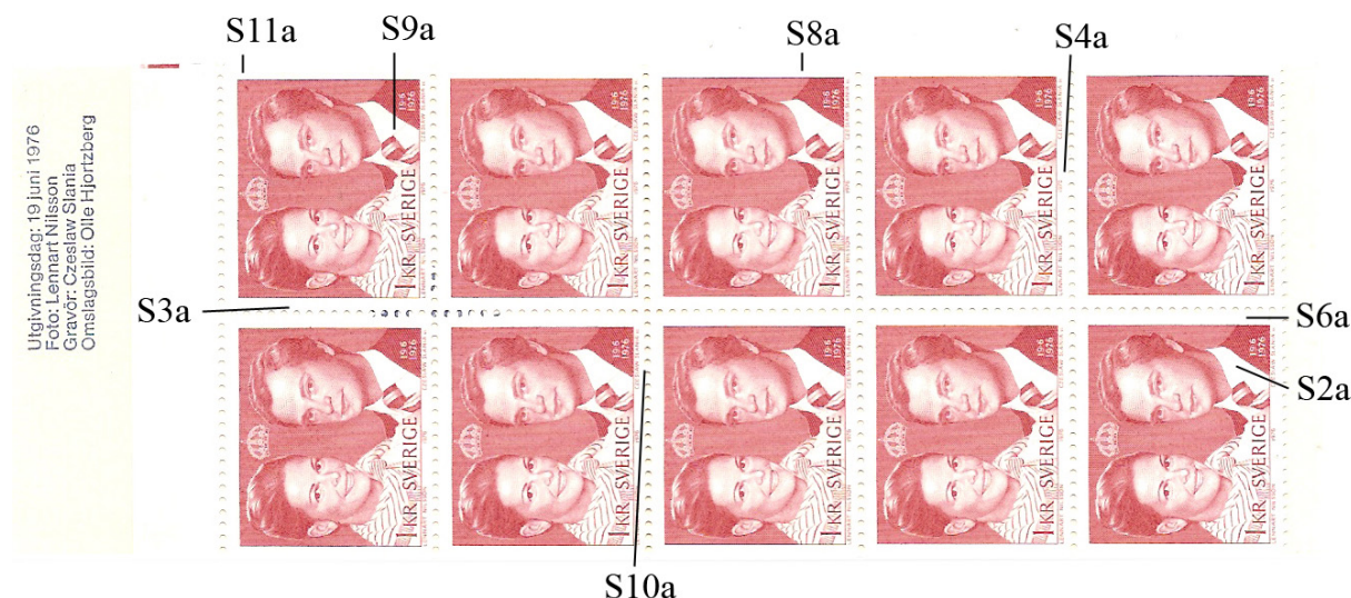
Tabell 2: Kännetecken på inlagor.

kombination med cyls, så sitter kn på inlagor med udda nummer. Om man har häften med kn i följd varav minst ett med kombination med cyls så är det lätt att fastställa nummer för de udda inlagorna. När det gäller numreringen av de jämna inlagorna behövs ett intakt cylindervarv eller helst en intakt 50-bunt. Först för några månader sedan fick jag tag i en öppnad förpackning med två 50-buntar. Det fanns enkla kn i dem. Genom att studera omslagsklichéer, förekomsten av cyls och om inlagorna kom som de skulle kunde jag konstatera att buntarna var intakta. Lyckan var stor. Äntligen hade jag alla pusselbitar.