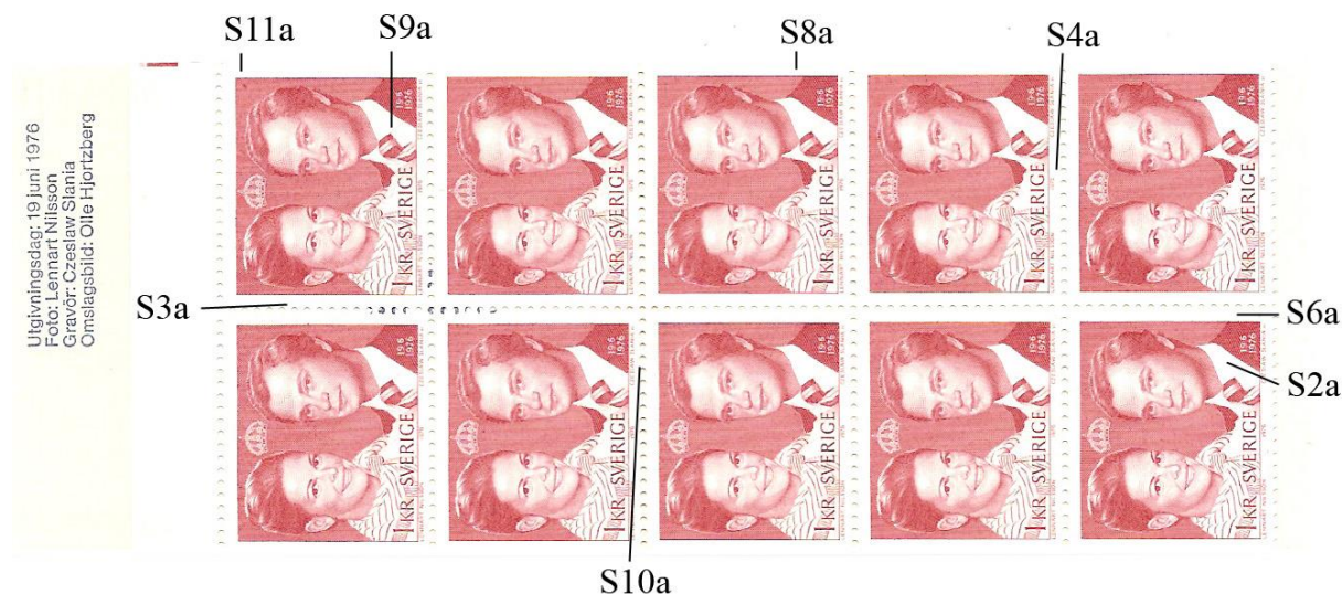
Tabell 2: Kännetecken på inlagor.

minst ett med kombination med cyls så är det lätt att fastställa nummer för de udda inlagorna. När det gäller numreringen av de jämna inlagorna behövs ett intakt cylindervarv eller helst en intakt 50-bunt. Först för några månader sedan fick jag tag i en öppnad förpackning med två 50-buntar. Det fanns enkla kn i dem. Genom att studera omslagsklichéer, förekomsten av cyls och om inlagorna kom som de skulle kunde jag konstatera att buntarna var intakta. Lyckan var stor. Äntligen hade jag alla pusselbitar.