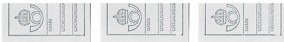
Figur 2 Skada bruten ram på ytterklichéerna 2b, 3b och 9b.

Vid inhäftningen i HM4 av TS 5–6, så har klichéerna 2, 3 och 9 skadats så att på sid IV vid nedre vänstra hörnet är det brott i ram eller stycke av ram är borta. Se figur 2. När klichén är hel så används beteckningen 2h, 3h och 9h och när den har brott 2b, 3b och 9b.