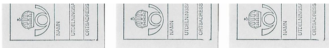
Figur 2 Skada bruten ram på ytterklichéerna 2b, 3b och 9b.

Vid inhäftningen i HM4 av TS 5–6, så har klichéerna 2, 3 och 9 skadats så att på sid IV vid nedre vänstra hörnet är det brott i ram eller stycke av ram är borta. Se figur 2. När klichén är hel så används beteckningen 2h, 3h och 9h och när den har brott 2b, 3b och 9b.