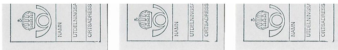
Figur 2 Skada bruten ram på ytterklichéerna 2b, 3b och 9b.

Vid inhäftningen i HM4 av TS 5–6, så har klichéerna 2, 3 och 9 skadats så att på sid IV vid nedre vänstra hörnet är det brott i ram eller stycke av ram är borta. Se figur 2. När klichén är hel så används beteckningen 2h, 3h och 9h och när den har brott 2b, 3b och 9b.